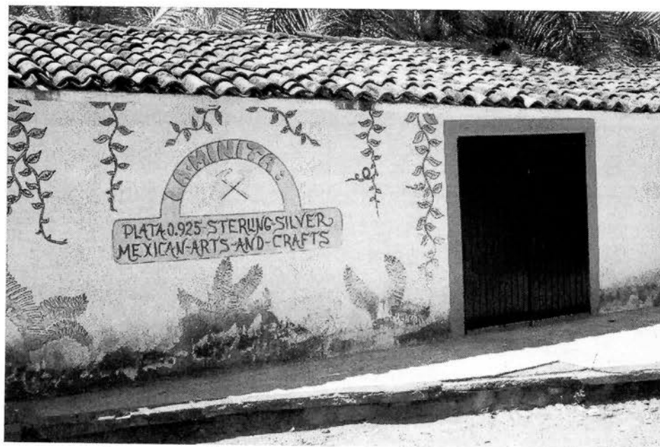
Lugar en el que se produciría y vendería la joyería

El taller de joyería en barro estuvo activo durante los años 2003 a 2013 ocupando físicamente una casa tradicional del pueblo ubicada al lado de la iglesia, esta casa era propiedad de un ciudadano americano quien nos animó, transmitió los conocimientos técnicos básicos para la elaboración de joyería, equipó el taller con un horno de alta temperatura y comercializó nuestros productos.